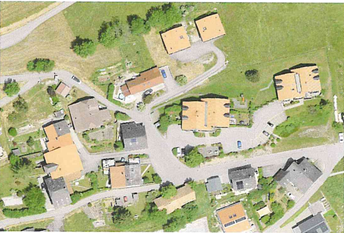
Carte d'ensemble Situation générale